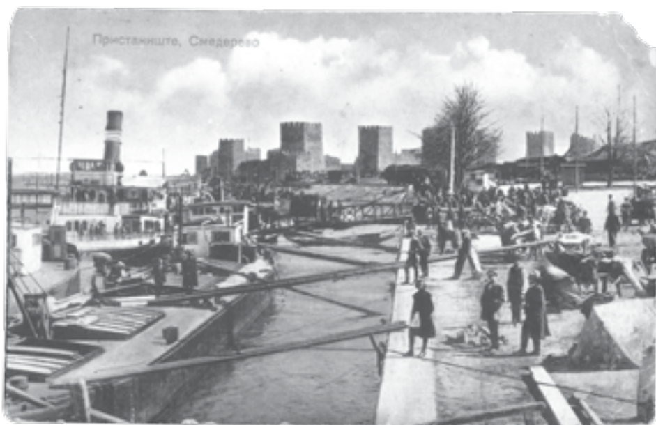
|Сл. 5. Разгледница Пристаниште, Смедерево, Издање књижаре Браће Пандуровић, Смедерево, 20-их година 20. века Извор: Историјска збирка Музеја у Смедереву, инв. бр. И-940/93