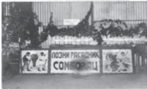
|Сл. 6–14. Фотографије са изложби приређених поводом прославе 500-годишњице Смедеревског града, непознат аутор Извор: Фонд Милана Јовановића Стоимировића, Народна библиотека Смедерево