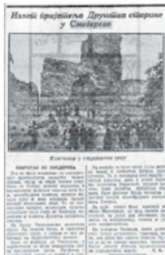
|Сл. 2. Време (исечак), Београд, 14. мај 1930, стр. 5

Ми данас не знамо да ли је у то време код највиших представника локалне самоуправе већ било јасних планова о времену и начину прославе. У поменутом чланку се, међутим, иницијална идеја о прослави приписује стручњацима из Београда: „Београд је учинио први корак у томе правцу, направио је најбољи и најправилнији увод у велику прославу. Друштво пријатеља старина бацило је прву искру, која ће разбуктати пламен интересовања меродавних и свих других“. 15 Па ипак, Смедеревци су, врло је извесно, већ у то време имали осећај о значају предстојеће прославе. О томе говори у прилог и још један извештај у дневним новинама „Време“, објављен два дана након посете Друштва, уз фотографију на којој се испред улаза у Мали град, поред чланова Друштва, виде и грађани Смедерева (сл. 2).