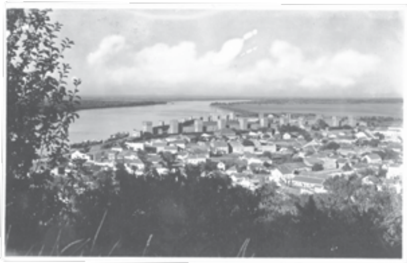
|Сл. 1. Разгледница Смедерево, Издање Фото архив „Путник“ Београд, 30-их година 20. века Извор: Историјска збирка Музеја у Смедереву, инв. бр. И-571/93

Овај неформални предлог из 1929. правдан је како значајем и очуваношћу некадашњег града деспота Ђурђа Бранковића, тако и величином простора у оквиру којег би се могло сместити и до 20.000 вежбача, које, због близине Београда, не би био проблем превести у Смедерево. Овакав стадион био би подесан за одржавање Свесловенског соколског слета у наредној, 1930. години. 2 Осим тога, аутори овог предлога имали су у виду и чињеницу да се 1930. „навршава 500 година од довршења Ђурђевог Града“, 3 што је ишло у прилог чињеници да се поменути слет одржи у Смедереву у оквиру овог значајног јубилеја (сл. 1).