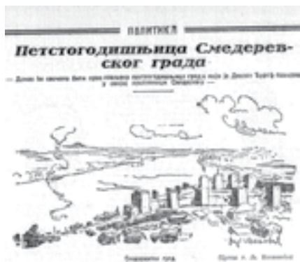
|Сл. 3. Политика (исечак), Београд, 5. октобар 1930, стр. 4

Бранковић“ објављене још 1880. у Београду. Овај текст 36 је илустрован цртежом Смедеревског града. Централни мотив цртежа је поглед на Смедеревску тврђаву и варош испред ње са брда Мајдан, чувеног српског графичара Љубомира Љубе Ивановића (сл. 3).