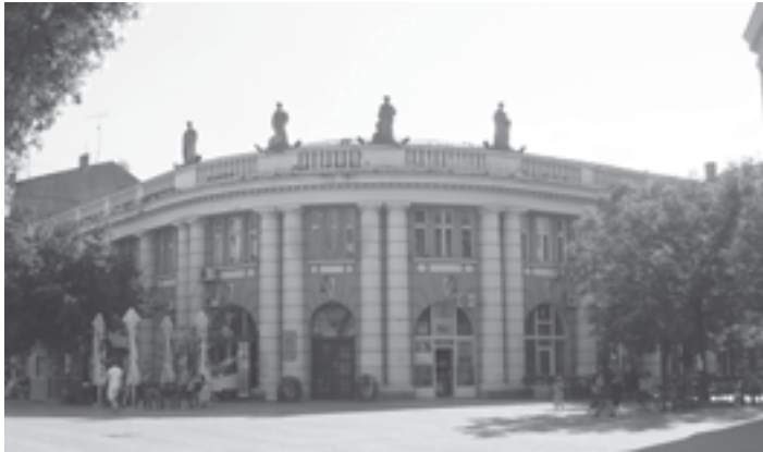
Сл. 2. Зграда Општинског дома, пројектант арх. Н. П. Краснов