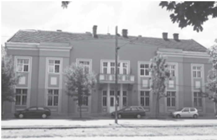
Сл. 3. Зграда Царинарнице, пројектант арх. Н. П. Краснов

Иако конзервативнијег просторно-декоративног склопа за своје време, ти објекти сведоче о потреби смедеревске средине да подржи „југославизацију“ архитектуре административних здања изграђених у националном академистичком стилу са елементима неоманиризма (Општински дом) и модернизованог академизма (Царинарница).