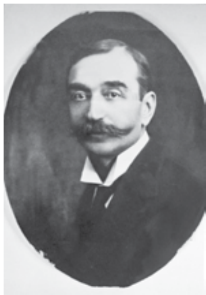
|Сл. 6. Архитекта Петар Ј. Поповић

Са становишта урбанистичке позиционираности међуратних објеката, било би их целисходно разврстати на угаоне и интерполиране зграде, слободностојећа издвојена здања и блоковске целине које су комуницирале путем специфичног визуелног дијалога, углавном базираног на стилском уклапању, висинском уједначавању и силуетном надовезивању, а понекад и на контрастном неслагању. Фасадну декорацију смедеревских међуратних објеката заступљену у фигуралној и рељефној форми, такође би требало детаљније проучити, са нагласком на њен стил, порекло, технику, симболику и улогу у систему архитектонских целина. 29