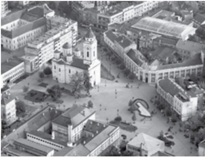
Сл. 5. Трг републике у Смедереву, снимак из ваздуха

Такође, при тумачењу стилистике индустријских капацитета требало би диференцирати примере безличног утилитаризма, модерног рационализма и умереног експресионизма, заступљених и у другим српским индустријским центрима. 25