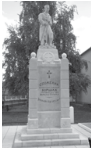
Сл. 2. Споменик изгинулим и умрлим борцима у ратовима 1912–1920. варошице Сараорца у Сараорцима