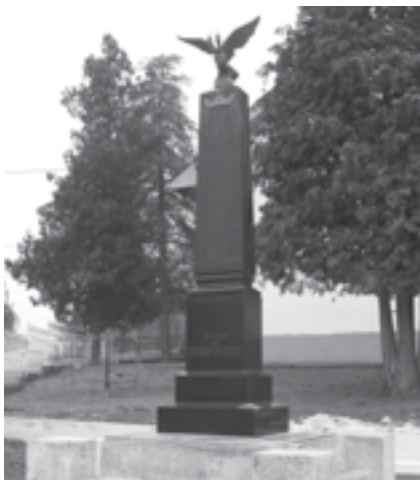
|Сл. 4. Споменик палим ратницима и заробљеницима 1912–1918. године у Малом Орашју