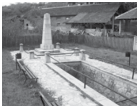
|Сл. 20. и 21. Спомен-чесма у Баничини – пре и након радова