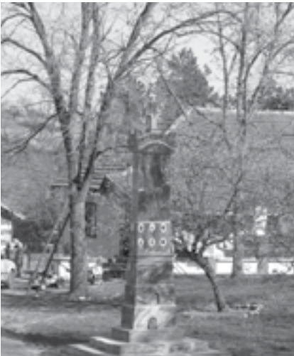
[Сл. 8. Споменик погинулим и умрлим херојима за отаџбину и уједињење српства 1912–1918. год. у порти цркве у Баничини

год. у порти цркве у Баничини (сл. 8) и Споменик палим за отаџбину 1912–1918. у центру Придворице, решени у форми каменог блока на постаменту (сл. 9). Споменик у Баничини подигнут је, као је уклесано: За владе њ. в. краља Петра I, 19. V 1921. Г. и прво је спомен-обележје подигнуто палим српским ратницима на подручју Подунавског округа 31 . Занимљиво је, да су по читавом споменику имена и презимена ратника са наведеним, чином, датумима и местима смрти, сликама на порцелану, као и ко од чланова породице споменик подиже. На врху је постављен крст који носе плитки стилизовани лучни елементи. У форми каменог блока без икаквих додатних елемената изведен је