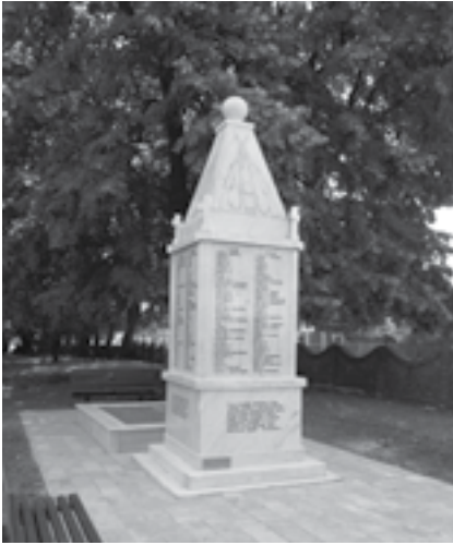
|Сл. 10. Споменик херојима из Голобока палим у ратовима 1912–1919. године и незнатим јунацима палим у одбрани Голобока 15. окт. 1915. године