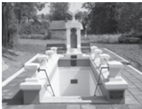
|Сл. 22. и 23. Спомен-чесма палим херојима општине суводолске у ратовима 1912–1918. у Суводолу – пре и након радова