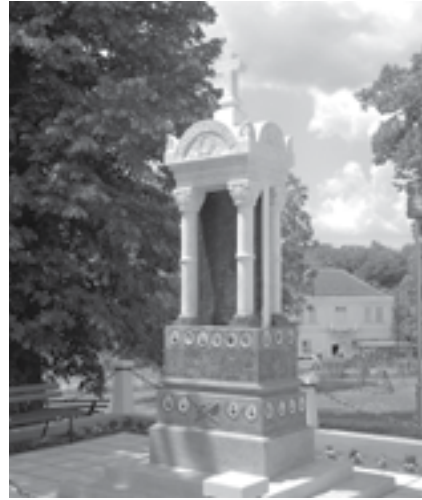
|Сл. 11. Споменик палим херојима у ратовима 1912–1918. год. у порти цркве у Ракинцу

у форми балдахина, са крстом на врху, који носе четири стилизована стуба од белог мермера, постављена на троделном постаменту 35 . Између стубова постављена је мермерна плоча са именима палих ратника 36 .