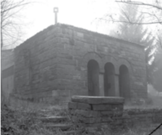
|Сл. 16. Немачко ратно гробље у Смедереву