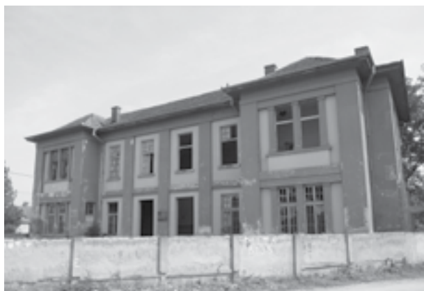
|Сл. 14. Спомен-дом краљу Александру и изгинулим ратницима у минулим ратовима у Лозовику

(бочним плитким ризалитима и пиластрима). Поводом 70 година од пробоја Солунског фронта Савез бораца и грађани Лозовика поставили су спомен-плочу са посветом: „Спомен дом изгинулим и умрлим ратницима од 1912–1918. за ослобођење и уједињење“.