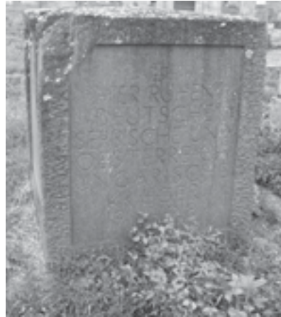
|Сл. 17. Споменик немачким, српским и аустроугарским ратницима 1914–1918. на гробљу у Марковцу

припремљен у радионици немачког Савеза 57 . Гробље је свечано освешћено 30. 05. 1937. године 58 .