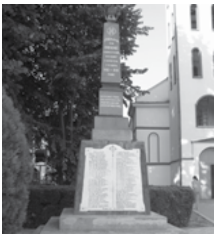
|Сл. 6. Споменик палим херојима за отаџбину и ослобођење у ратовима 1912–1918. у порти Цркве Светог Јелисеја у Доњој Ливадици