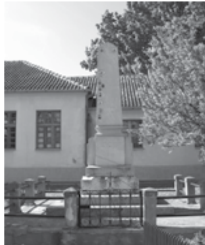
[Сл. 9. Споменик палим за отаџбину 1912–1918. у центру Придворице

Споменик у Придворици , који су подигли родитељи и фамилије палих ратника, како је наведено: „ сваки своје “, 1923. године.