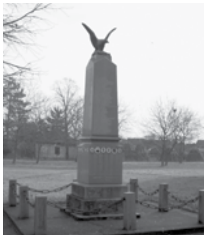
|Сл. 5. Споменик палим борцима балканског и светског рата – осветницима Косова 1912–1918. у црквеној порти у Старом Селу (тада Старом Аџибеговцу)