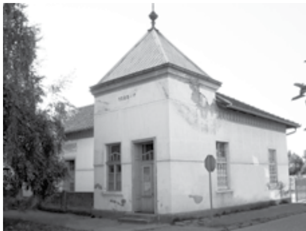
|Сл. 13. Спомен-дом у славу и спомен погинулих и помрлих грађана општине милошевачке за слободу и уједињење 1912–1919. год. у Милошевцу