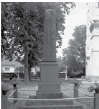
|Сл. 7. Споменик Новоаџибеговцима који падоше бранећи краља и отаџбину у ратовима од 1912. до 1919. год као и онима што падоше у ропству славе им у Новом Селу

Да су меморијали, који су подизани у мањим местима првих послератних година, резултат спонтаних иницијатива грађана које је зближавала бол и туга за погинулим 30 , о чему сведоче: Споменик погинулим и умрлим херојима за отаџбину и уједињење српства 1912–1918.