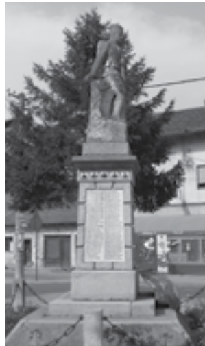
Сл. 3. Споменик изгинулим, помрлим и несталим Марковчанима за ослобођење и уједињење у рату 1912–1918. год. у Марковцу

Веома заступљену групу јавних споменика представљају споменици у виду обелиска 22 . Поред чисте геометријске форме, која је сама по себи носила одређену симболику, често су се на њима постављале фигуре орла (двоглавог или једноглавог), крстови, државни или амблеми војних удружења. Фигура двоглавог орла имала је хералдичко значење, у коме се препознаје дуалитет државе и цркве, док је