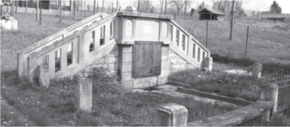
|Сл. 12. Спомен-чесма палим борцима 1912–1918. у Башину

Суводолу споменика са плочом и крстом и двоглавим орлом раширених крила на врху. Спомен-чесма у Башину је решена у форми моста.