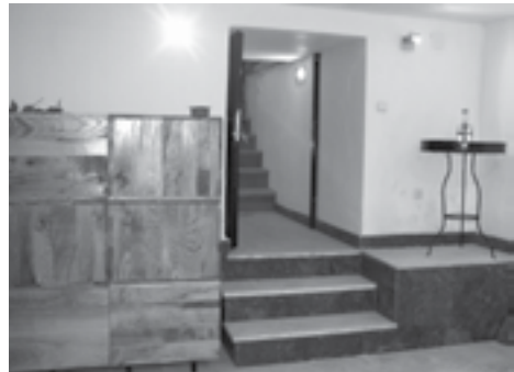
|Сл. 18. и 19. Црква Светог пророка Јеремије у Врбовцу и изглед спомен-костурнице