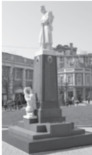
Сл. 1. Споменик изгинулих и умрлих војних обвезника из Смедерева у рату 1914–1919. године у Смедереву

српског сељака у опанцима 20 (с тим да је на смедеревском уз војничку изведена и фигура младића у народној ношњи са победничким венцем), док је на споменику у Марковцу приказана нешто модификованија, улепшана верзија под пуном ратном опремом 21 .